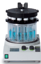
Multivapor™ P-6 / P-12 Evaporasi yang efisien untuk banyak sampel