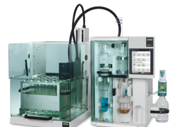
KjelMaster System K-375 / K-376 / K-377 Distilasi, titrasi dan pengambilan sampel otomatis