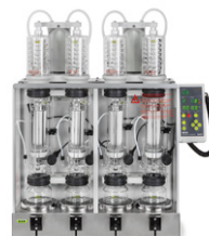
Extraction Systems B-811 / B-811 LSV Ekstraksi universal