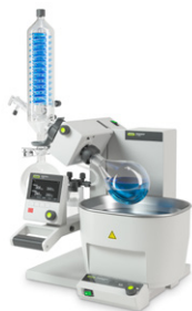
Rotavapor® R-300 Rotary evaporation yang mudah dan