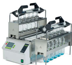
SpeedDigester K-439 / K-425 / K-436 Digestión IR