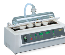
Wet Digester B-440 焚烧