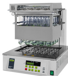
KjelDigester K-446 / K-449 Digestión en bloque