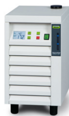
Recirculating Chiller F-100 / F-105 Modo de refrigeração simples