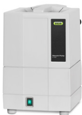
Vacuum Pump V-100 Fonte de vácuo econômica