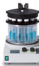
Multivapor™ P-6 / P-12 Evaporação eficiente para amostras múltiplas