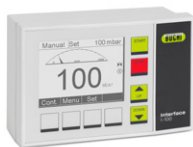
Interface I-100 Controle de vácuo econômico