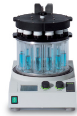
Multivapor™ P-6 / P-12 高效的多样品蒸发仪