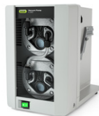
Vacuum Pump V-300 经济、无噪音的真 空源