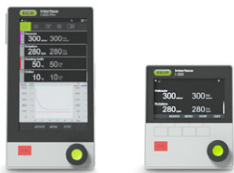
Interface I-300 / I-300 Pro 集中触摸屏控制、 记录和图表显示