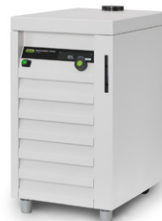
Recirculating Chiller F-305 / F-308 / F-314 高效、节水的冷却方式