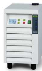
Recirculating Chiller F-100 / F-105 간편한 냉각 솔루션