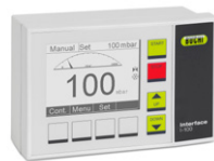
Interface I-100 经济型真空调节 解决方案