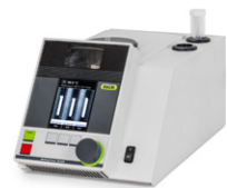
Melting Point M-560 / M-565 熔点测定