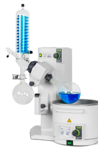
Rotavapor® R-215 性能优异的蒸发性能