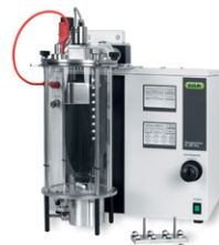
Encapsulator В-395 Pro

Распылительная сушилка для образцов небольшого объема и частиц