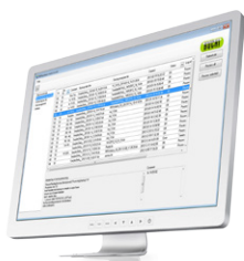
NIRAnywhere Software 网络解决方案