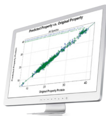
Quick-start calibrations 输送、食品、碾磨和烘培