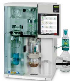
KjelMaster K-375 蒸汽蒸馏和滴定