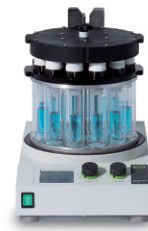
Multivapor™ P-6 / P-12 複数の資料を効率的に 蒸留