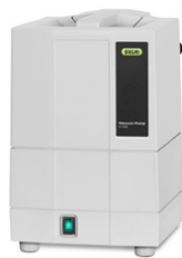
Vacuum Pump V-100 経済的な真空源