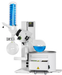
Rotavapor® R-100 経済的な蒸留 ソリューション