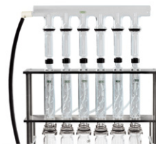
Reflux Setup С водяным или воздушным обратным холодильником