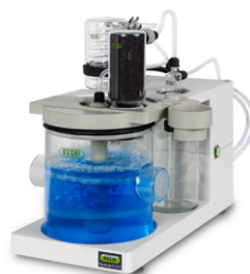
Scrubber K-415 Нейтрализация