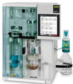
KjelMaster K-375 Паровая дистилляция и титрование