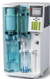
KjelFlex K-360 Паровая дистилляция